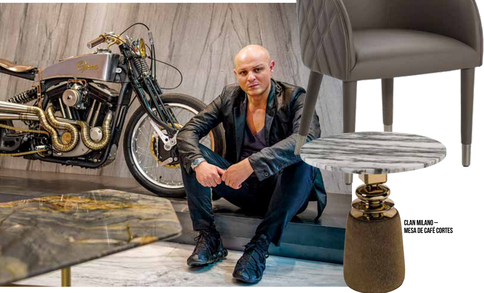
CLAN MILANO – MESA DE CAFÉ CORTES

favorecer o meu interesse pelo design: a minha família - a típica família italiana do Sul - apresentou notáveis habilidades manuais que nos permitiram criar várias coisas: desde móveis de casa e bicicletas, aos acessórios pequenos e etc. Meu avô me inspirou na maior parte e, seguindo seus passos, projetei e produzi minha primeira cama e bicicleta. Eu era apenas um adolescente, mas ainda me orgulho muito delas.