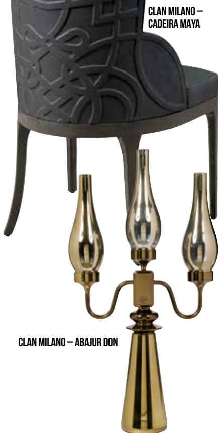
CLAN MILANO – CADEIRA MAYA