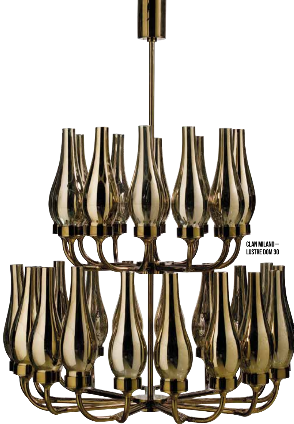
CLAN MILANO – LUSTRE DOM 30

"O espaço é um desafio, não uma limitação." O designer Alessandro La Spada não experimenta limitações, mas sim, o desafio de criar sem barreiras, com muita criatividade, curiosidade, utilizando todos os materiais possíveis. Seja para compor interiores ou uma de suas obras criativas, as formas e composições trazem originalidade em cada detalhe.